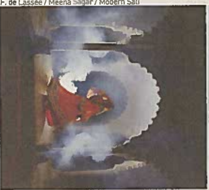
F. de Lassée / Meena Sagar / Modern Sati

18 h 30 Floriane de Lassée dévoile l'Inde moderne